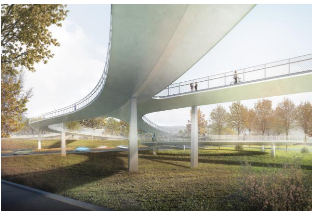
Visualisierung der Untersicht