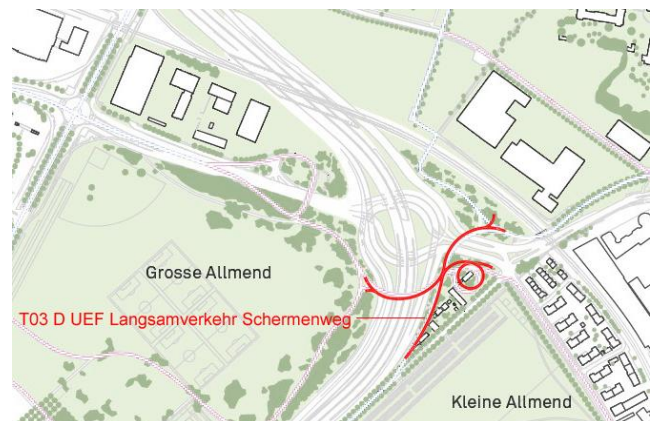
Situation mit neuem Autobahnanschluss