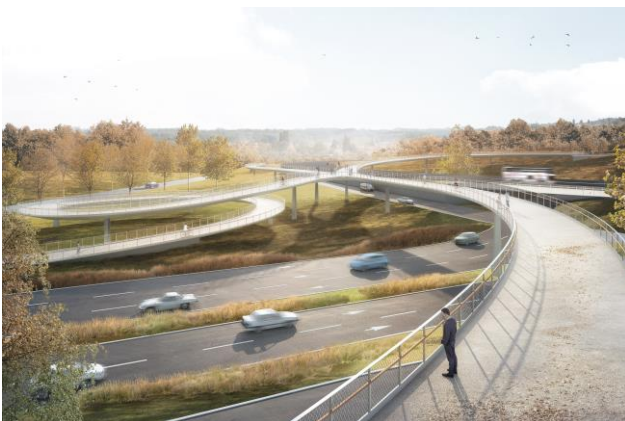
Visualisierung mit Blick Richtung SW

Besonderes: - Wettbewerbssieg aus zweistufigem Verfahren - Hohe gestalterische Anforderungen im urbanen Gebiet / Interdisziplinäres Planungsteam - Bauen unter Aufrechterhaltung des Verkehrs, zusammen mit den anderen Arbeiten am Anschluss - Schwingungsanfälliges Bauwerk (Kompensation mittels Tilger vorgesehen)